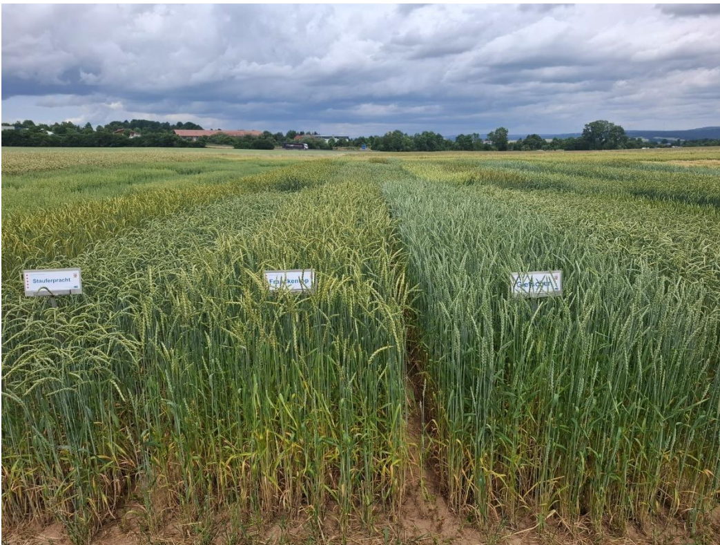
Abb. 1: LSV Öko Winterdinkel Alsfeld-Liederbach am 23.06.2025

Der Anbau von Dinkel hat gerade im Ökolandbau schon immer eine gewisse Bedeutung und er ist oftmals eine etablierte Kultur in biologisch wirtschaftenden Betrieben. Die Vermarktung gestaltet sich allerdings nicht immer ganz einfach. Gerade in jüngster Vergangenheit zeigten sich durch Übermengen in den Jahren 2022/23 erhebliche Absatzschwierigkeiten. Seit verganginem Jahr entspannt sich die Marktsituation wieder etwas. Dinkel, oder auch Spelzweizen genannt, ist eine Kulturform des Weizens, der in der Regel nicht frei dreschend ist. Das heißt, dass im Gegensatz zum normalen Weizen die Körner nach dem Drusch nicht entspelzt vorliegen, sondern in Ährenbruchstücken mit zwei bespelzten Körnern, den sogenannten Vesen. Der Spelzanteil liegt sorten- und jahresabhängig in etwa bei 20 bis 25 %, sodass der reine Kornertrag um diesen Faktor unter dem Vesenertrag liegt. Während der Anbau hinsichtlich Saatbettbereitung und Aussaat mit dem des Weizens vergleichbar ist, sind die Ansprüche des Dinkels an Standort und Nährstoffversorgung vergleichsweise geringer. Daher bietet sich eine Fruchtfolgestellung zum Beispiel nach Kartoffeln oder Körnerleguminosen an. Bei einer üppigeren Stickstoffversorgung kann der Dinkel, je nach Sorte, mitunter auch gern mal ins Lager gehen