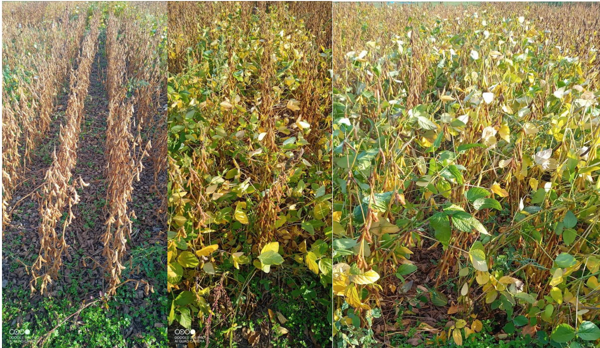
Abb. 2 Unterschiedliche Abreifestufen im LSV Öko Soja an der Weilburger Grenze am 23.09.2025

Links: Vollständig abgereifte Sorte ohne Reifeverzögerung; Mitte: deutliche Reifeverzögerung der Blätter; Rechts: Noch nicht abgereift (zum Teil noch grüne Hülsen)